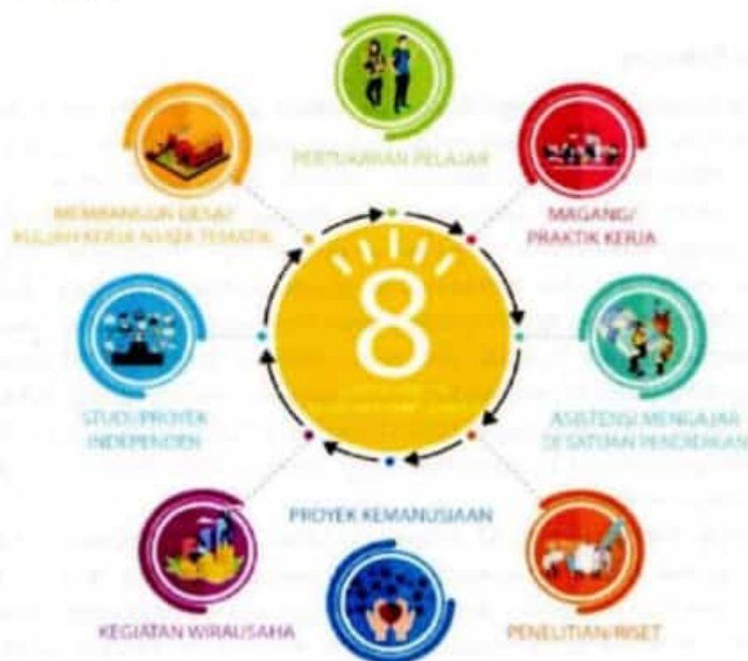
Gambar 1. Bentuk Kegiatan Pembelajaran MBKM

studi dengan berbagai pihak/mitra yang diharapkan dapat mendukung keberhasilan proses pembelajaran.